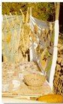
Echantillon de semences de l'Himalaya

Bharat Dogra, participant indien, nous propose un récit de la rencontre où chaque intervention illustre et justifie les inquiétudes liées aux OGM et la prudence requise quant à leur développement.